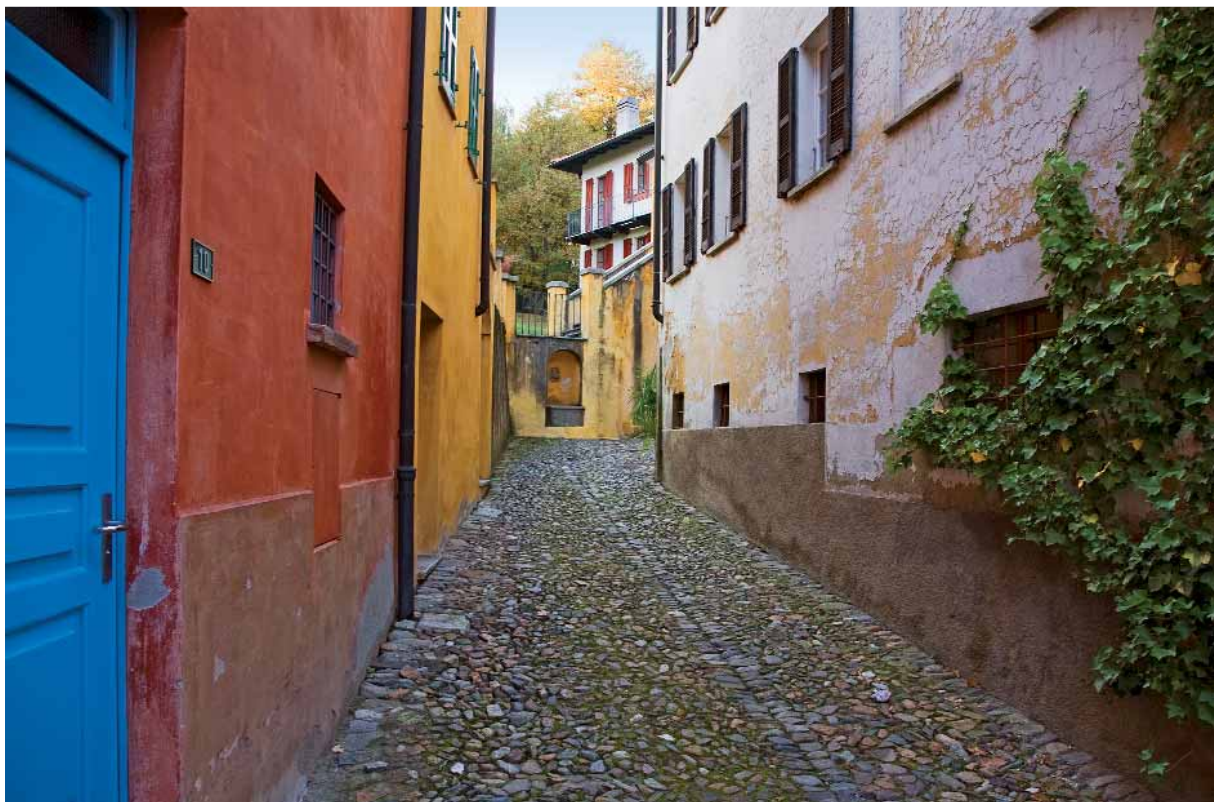
▼ ViaGottardo: Il gioco di colori delle facciate in un vicolo di Carona

Uri e Ticino offrono ottime condizioni per la realizzazione di VieRegio, per una semplice ragione: nelle valli discoste le vie storiche si sono conservate meglio che altrove. Da un lato perché dopo la costruzione delle strade carreggiabili i vecchi tracciati sono rimasti intatti, dall'altro perché spesso mancavano i soldi per ampliare le vecchie strade. Tra gli scopi futuri di Itinerari culturali della Svizzera rientra quello di potenziare al massimo le possibilità offerte dalle VieRegio. Tre esempi consentono di capire la molteplicità dell'offerta di Uri e Ticino: sulla ViaRegio Suworow si potrà rivivere l'epica impresa del famoso generale russo con i suoi 24000 soldati e le colonne di muli che li accompagnavano. Sulla ViaRegio Ferrovia del Gottardo diventano tangibili tutte le dimensioni di quella costruzione epica, dalle meraviglie tecniche alle ricadute sociali. Chi preferirà immergersi nel mondo dei maestri comacini, nei dintorni di Mendrisio scoprirà non solo l'opera artistica di mastri muratori, pittori e architetti altamente qualificati, ma anche mulattiere storiche, un cangiante paesaggio naturale e un'attraente cucina contadina. Tutte cose che val la pena di gustare.